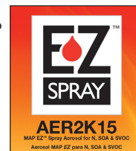
Etiqueta AER2K15/EZ en parte inferior